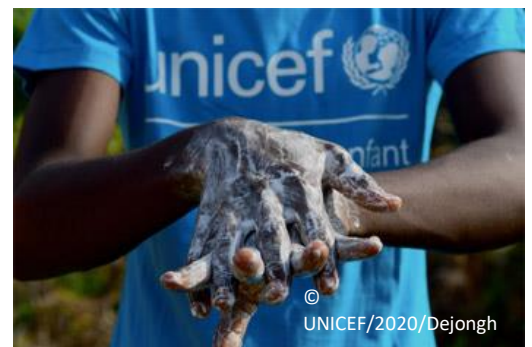
Un trabajador de UNICEF se lava las manos en Abidjan, en el Sur de Costa de Marfil